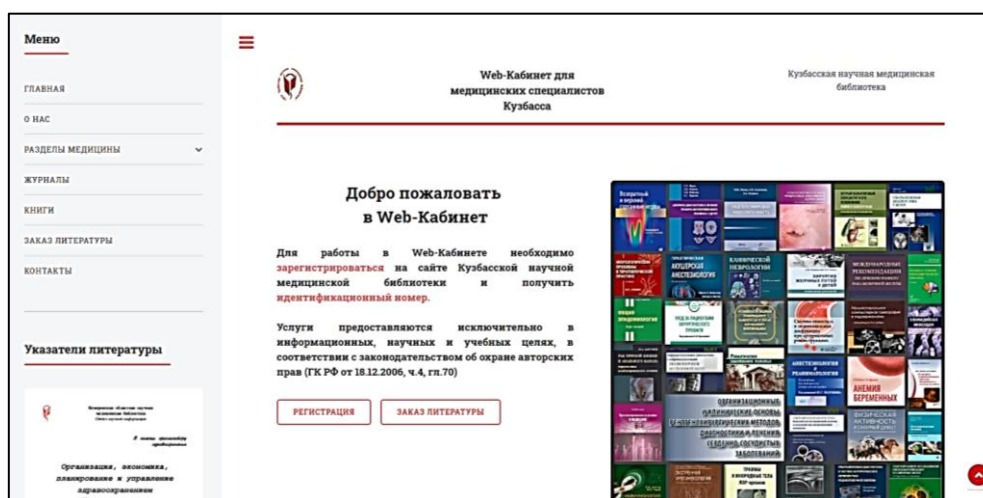
Рисунок 1 – Главная страница электронного ресурса

Характеристика созданного ресурса. Для данных целей в 2019 году был разработан, отлажен и запущен в эксплуатацию новый электронный библиотечный ресурс «Web-Кабинет для медицинских специалистов Кузбасса» [1] – www.medlib.kuzdrav.ru/web-cabinet (рис. 1).