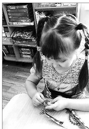
Рисунок 2 – Воспитанница детсада за вышивкой чувашского орнамента