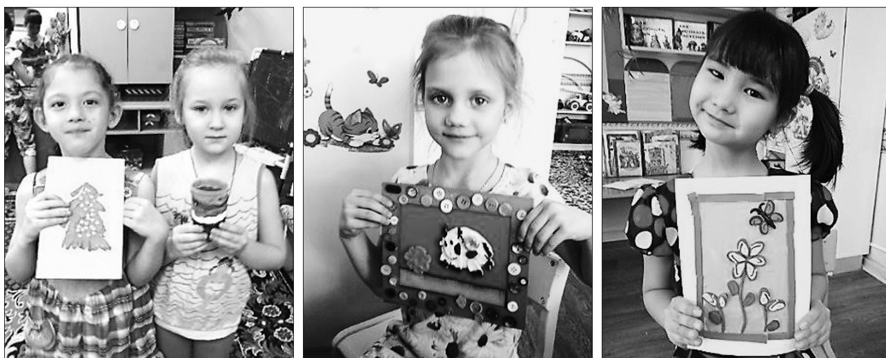
Рисунок 1 – Демонстрация готовых изделий из глины

В современном мире существует аналог натуральной глины – полимерная глина. У этого материала очень много преимуществ, она пластична, красочна, не прилипает к поверхности и к рукам, после запекания очень прочная; единственный недостаток: при запекании токсична, поэтому помещение должно быть проветриваемо.