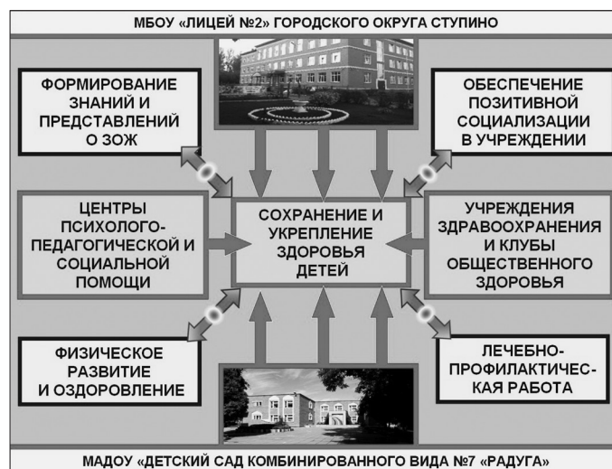
Рисунок 1 – Модель преемственной здоровьесберегающей среды «Детский сад – начальная школа»

7) создание актуальной системы информирования участников инновационного проекта и общественности о результатах здоровьесберегающей деятельности учреждений-участников проекта (через СМИ, социальные сети, сайты учреждений, публичные отчеты и др.).