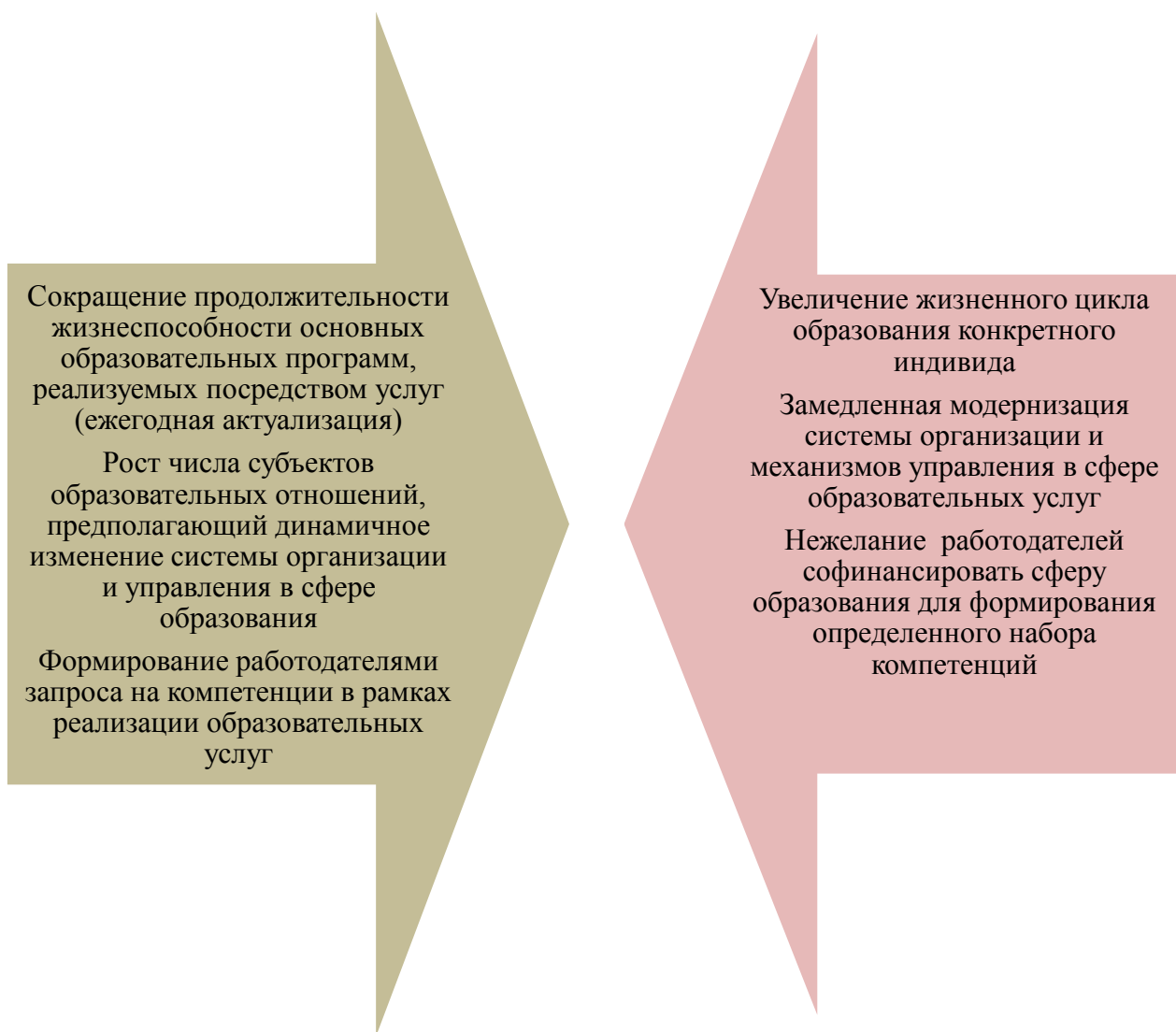
Рисунок 3 – Объективные противоречия развития рынка образовательных услуг

Перечисленные факторы могут лишь косвенно объяснить наличие объективных противоречий, провоцирующих диффузию на рынке образовательных услуг (рисунок 3).