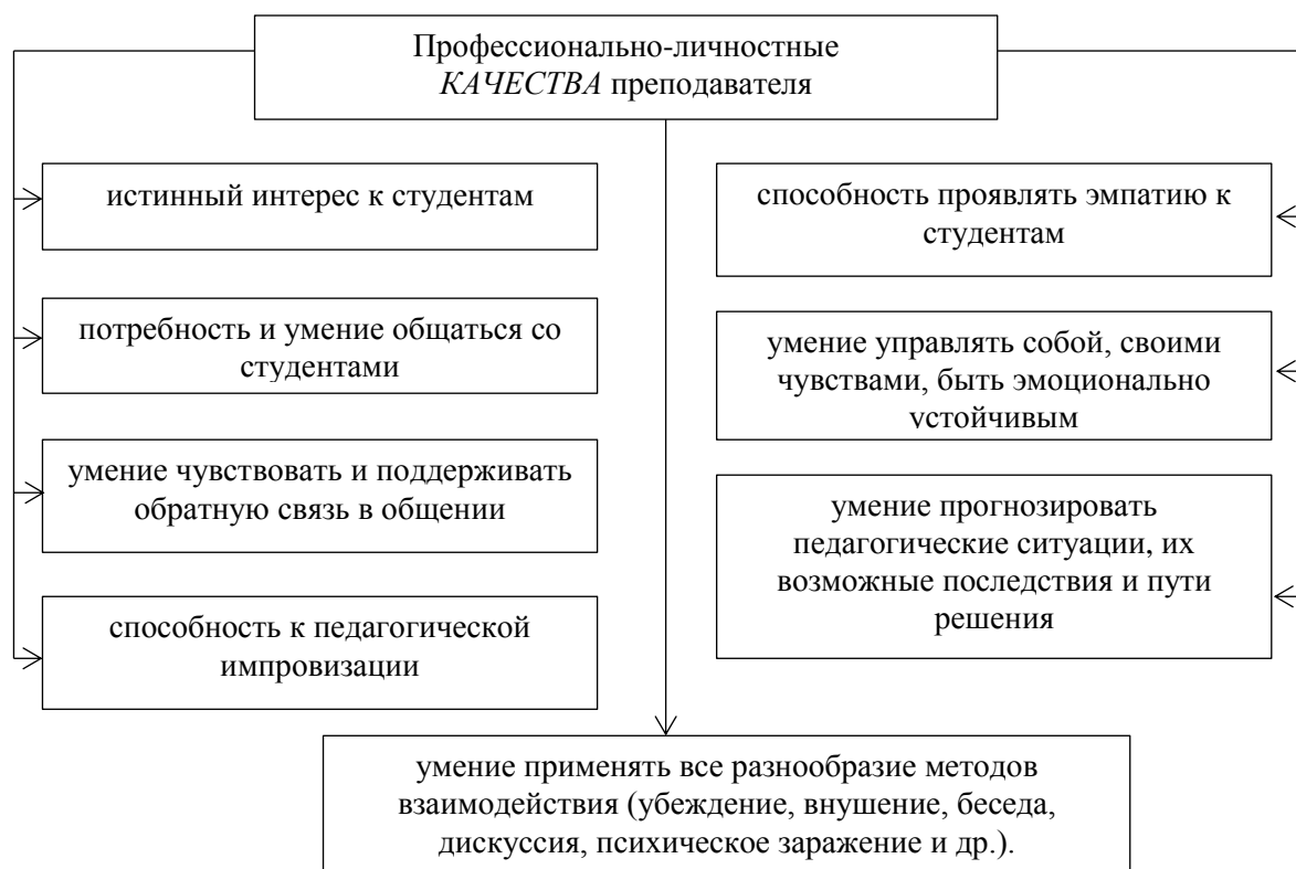
Рисунок 2 – Основные составляющие в структуре коммуникативной компетентности преподавателя вуза

Кроме выше представленных коммуникативных умений и способностей в структуре коммуникативной компетентности преподавателя, особо стоит сказать о профессионально важных личностных качествах преподавателя, наличие которых является катализатором становления профессионально компетентного преподавателя вуза (Рисунок 2).