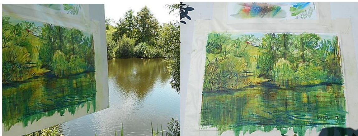
Рисунок 4 – Мастер-класс. Акварельные карандаши

Ряд мастер-классов окажут помощь при выполнении практических заданий по теме «Кратковременные этюды пейзажа на большие отношения», по теме: «Архитектурные мотивы», «Этюды деревьев» а также по теме: «Выполнение упражнений – этюд на выделение в композиции главного элемента пейзажа» (рис. 4).