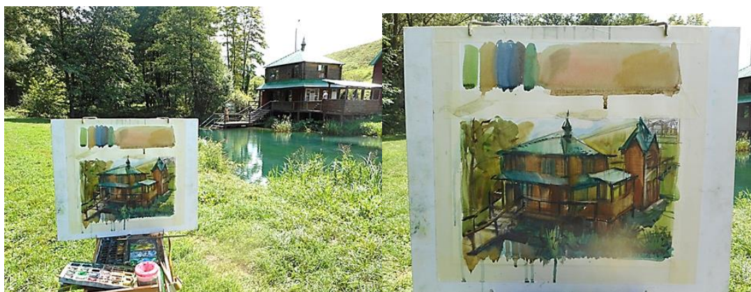
Рисунок 1 – Мастер-класс. Купальня «Криница».

Урок «Кратковременные этюды пейзажа на большие отношения»