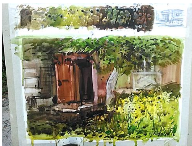
Рисунок 3 – Мастер-класс. Этюд городского пейзажа в смешанной технике с применением парафина. Выполнение упражнений: этюд на выделение в композиции главного элемента пейзажа