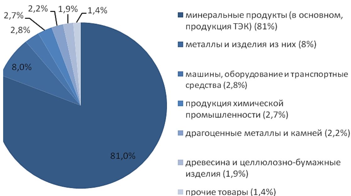
Рисунок 1 – Структура инвестиций Германии в России. Основные отрасли за 2014 г.

На сегодняшний день в России свыше 5 тысяч фирм с участием германского капитала. К сожалению, количество идет на спад, но есть перспективные направления инвестиционного сотрудничества с Германией для России. Так, например, автомобилестроение, деревообрабатывающая промышленность, авиастроение, металлургия, электротехническая, промышленность, транспортное и энергетическое машиностроение, производство строительных материалов, химическая и фармацевтическая промышленность. Структура инвестиций Германии в России представлена на рис. 1.