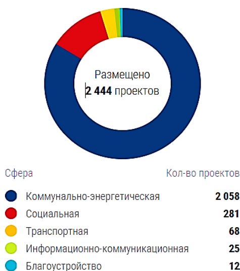
Рисунок 1 – Распределение проектов по сферам в рамках базы ГЧП

Первым этапом исследования стал сбор информации для дальнейшего анализа. Несмотря на то, что данные, касающиеся реализуемых на территории РФ проектов по схеме ГЧП, сосредоточены в одном месте, назвать данную информацию исчерпывающей нельзя. Тем не менее с помощью этого ресурса получены данные касательно количества реализованных, либо готовящихся к реализации ГЧП проектов, объема общих инвестиций в проект, а также компаниях, выступающих в качестве инвестора (табл. 1).