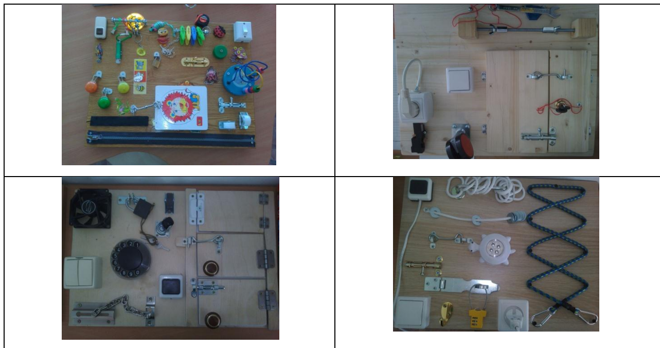
Таблица 2. Фотоотчет

при изучении разнообразных пальчиковых игр речь становится формой общения детей, дети с удовольствием составляют рассказы из двух-трех простых предложений.