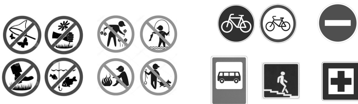
Рисунок 1 – Экологические и дорожные знаки

Выполняя предложенное задание, дети выбирают соответствующие знаки.