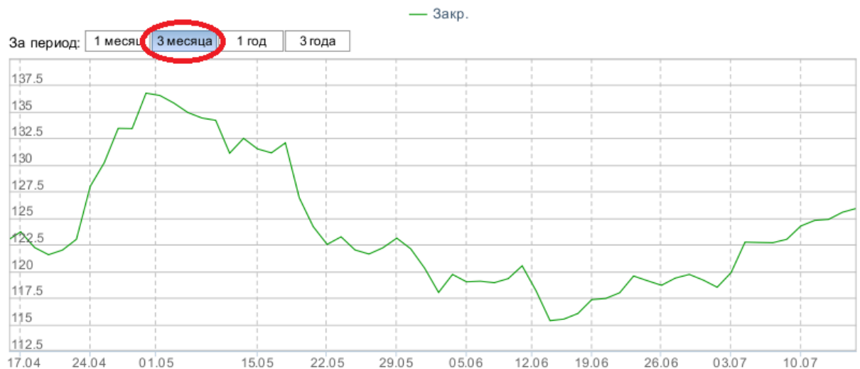
Рисунок 2 – Динамика акций Газпрома за три месяца

Далее давайте рассмотрим изменение курса акции, только уже не за один месяц, а за три. Насколько изменятся прогнозы и действия инвестора, при использовании и анализе данной информации. Данные представлены за период с 17.04.2017 г. по 14.07.2017 г. (рисунок 2).