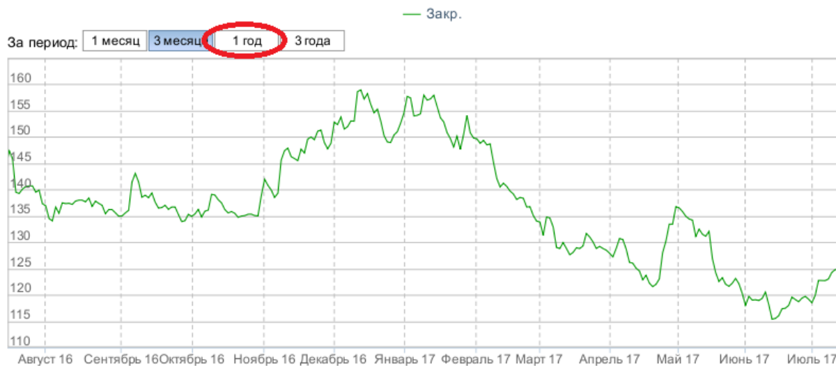
Рисунок 3 – Динамика акций Газпрома за год

А теперь рассмотрим последний график, где данные представлены за целый год. Период: 01.07.2016 г. – 01.07.2017 г. (рисунок 3).