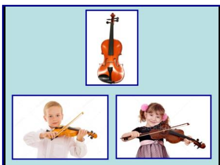
Рис. 2 Пример оформления слайда