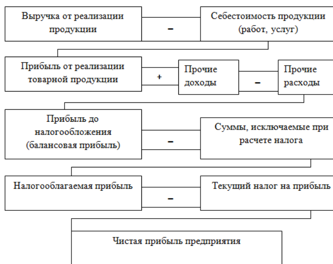
Рисунок 2 – Механизм формирования прибыли

На основании бухгалтерского учета формируется бухгалтерская отчетность, которая является информационной базой при анализе прибыли. На рис. 2 представлен процесс формирования прибыли [3, с. 267].