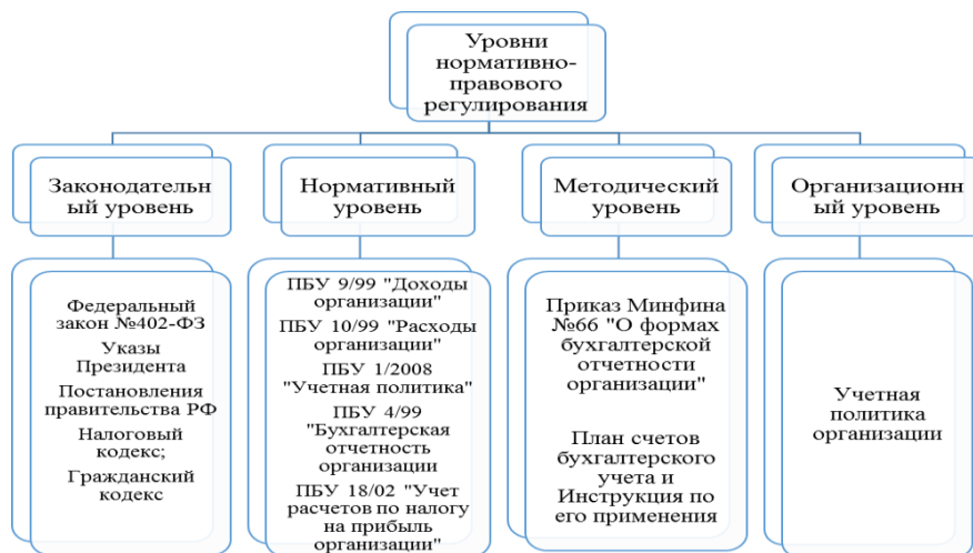
Рисунок 1 – Уровни нормативно-правового регулирования

нормативно-правовые акты, используемые для учета финансовых результатов [4].