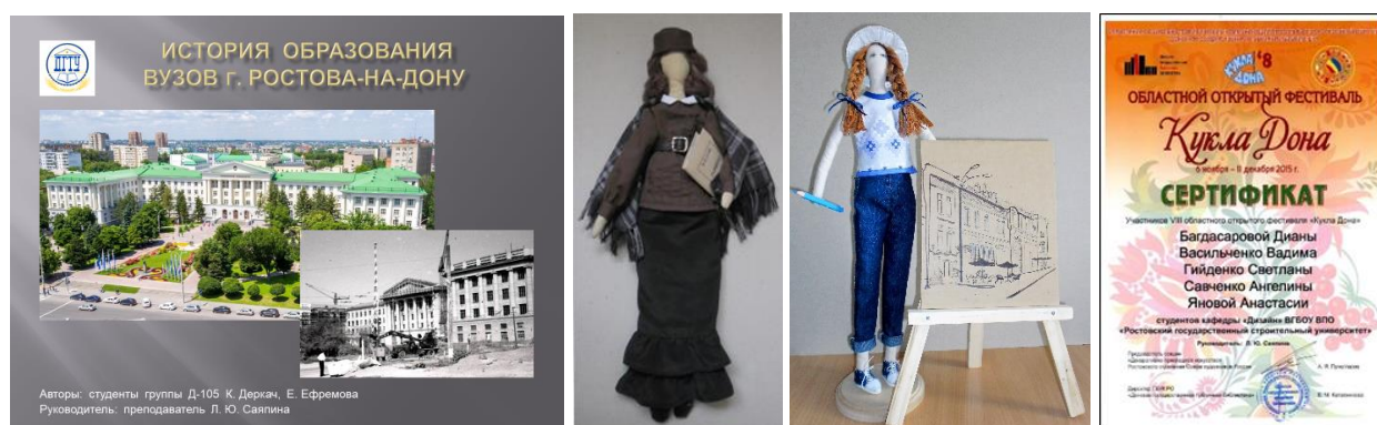
Рисунок 2 – Материалы участия в выставке

Слева – слайд презентации по истории вузов; в середине – текстильные куклы в костюмах студенток 80-х г. XIX веков; справа – сертификат коллективной выставочной работы студентов