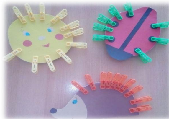
Театр «Ежик и грибок»