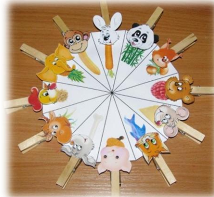
«Кто, что ест»