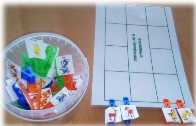
«Животные и их детеныши»