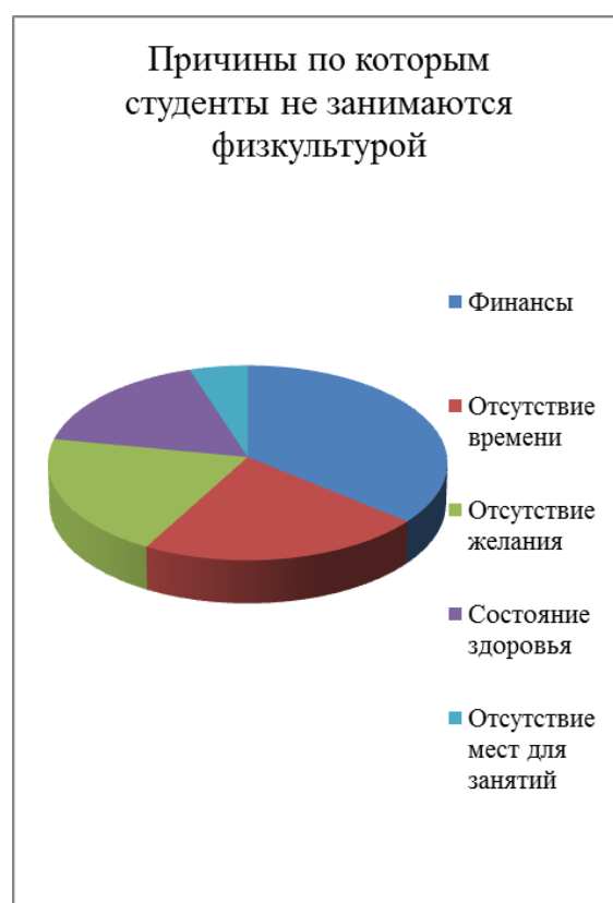
Рисунок 10 – Результаты опроса по причинам нежелания заниматься физической культурой

По данным статистики, доля молодых людей, систематически занимающихся физической культурой и спортом, хотя и растет с каждым