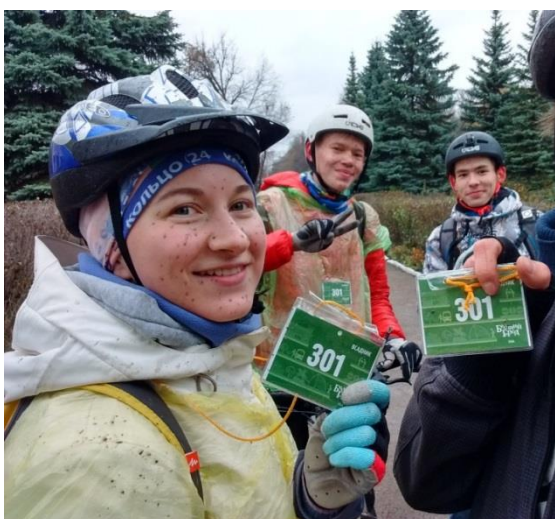
Рисунок 7 – Соревнования «Бегущий город»-2015, г. Уфа