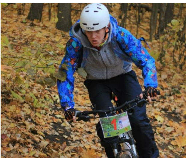
Рисунок 8 – Собственные любительские соревнования Кубок ВЕЛОУТЭК-2014, г. Уфа

Учебные заведения, в том числе КГЭУ, также имеют возможность внести свой вклад в развитие личностных предпочтений молодёжи. Так, студенты, проявляющие инициативу в участии и организации спортивных мероприятий, положительно мотивируются в учебе.