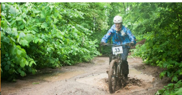
Рисунок 2 – Любительские соревнования по велокроссу Кантри, этап «Огонь, Вода, Медные трубы» - 2015, г. Уфа