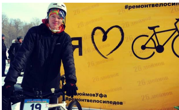
Рисунок 1 – Любительские соревнования по велокроссу Кантри ХСЕ Метелица-2018, г. Уфа

Сейчас популярность спорта, как на любительском уровне, так и профессионального, подогревается масс-медиа и профильными магазинами как часть маркетингового плана. В рамках учебных заведений были введены определённые требования к экипировке учеников и студентов, что также мотивирует их заниматься спортом в свободное время. На уровне страны культивируются прибыльные отрасли, такие как футбол, хоккей. В рамках городов и в учебных заведениях набирают популярность горнолыжные комплексы, велосипедные мероприятия и соревнования: триатлон, марафон, экстремальные соревнования (рис. 1-8) [7].