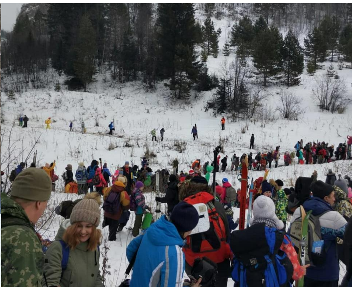
Рисунок 6 – Туристический слет Снежинка-2018, г. Аша Челябинская область