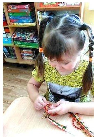
Рисунок 2 – Воспитанница детсада за вышивкой чувашского орнамента

• самостоятельная декоративно-орнаментальная деятельность детей, организованная взрослыми, в ходе которой они создают обобщённый орнаментальный образ (рис. 2)