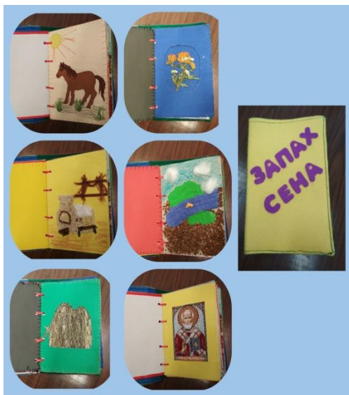
Рисунок 4 – Тактильное издание рассказа В.П. Астафьева «Запах сена»

В рамках 95-летия со дня рождения писателя сотрудники «Межпоселенческой библиотеки» создали «Взрослое тактильное рукодельное издание» по рассказу «Запах сена», которое было отмечено Дипломом II степени в краевом конкурсе на лучшее тактильное издание, посвященном творчеству В.П. Астафьева (рис. 4).