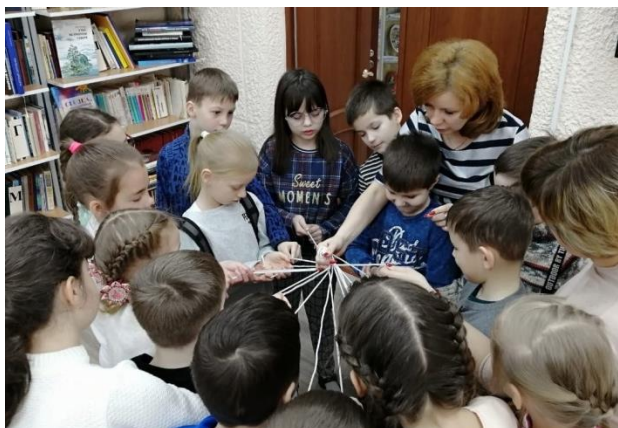
Рисунок 1 – Деление на команды

ними команды) образуем две команды (рис. 1). Каждая команда будет на протяжении всей игры работать именно таким составом.