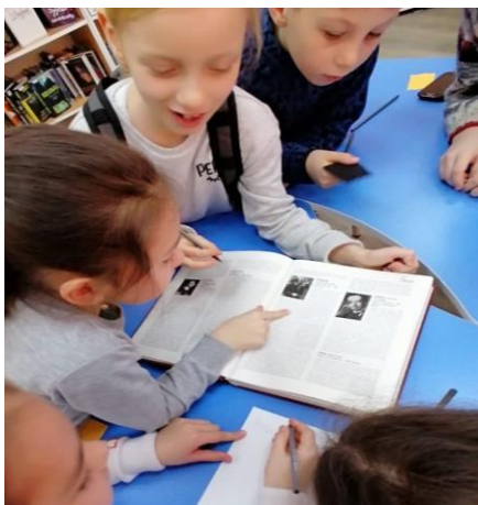
Рисунок 2 – Работа с биографической энциклопедией

фамилий. Вы должны найти «необычные фамилии». За одну минуту каждая команда постарается найти как можно больше фамилий. Кто больше? (рис. 2).