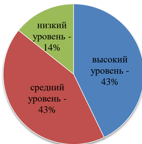
Рисунок 1 – Диагностические результаты уровня эмоционального развития детей дошкольного возраста с использованием 3-х методик

По результатам диагностик (см. рис. 1) можно сделать вывод: у 9 детей (43%) определён высокий уровень эмоционального развития, у 9 детей (43%) – средний уровень и у 3 детей (14%) – низкий.