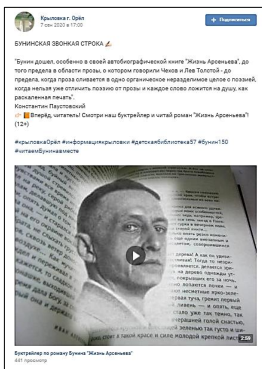
Рисунок 2 – буктрейлер «Жизнь Арсеньева»

платформах в «Одноклассниках» и «ВКонтакте» были представлены: музыкальный видеорлик «Господин из Орловской губернии. Иван Бунин», онлайн-кроссворд и онлайн-калейдоскоп «Листопад рассказов Бунина», поэтическая онлайн-викторина «Осыпаются астры в садах», а также онлайн-экскурсия «По бунинским местам Орла». В завершение акции прозвучали романсы на стихи Ивана Алексеевича Бунина, которые исполнили преподаватели Орловского музыкального колледжа [1].