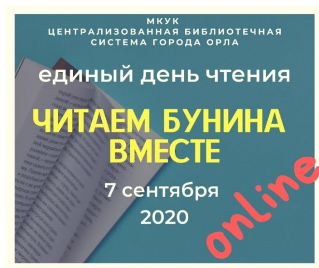
Рисунок 1 – «Единый день чтения-2020»

В «Единый день чтения» в библиотеках и учреждениях-партнёрах библиотек вслух читают произведения писателей. «Единый день чтения» 2019 года ЦБС г. Орла полностью отвела краеведческой теме, обозначив акцию как «Читаем орловских писателей». В следующем году весь мир отмечал 150-летие со дня рождения Ивана Алексеевича Бунина, поэтому было принято решение посвятить «Единый день чтения-2020» И.А. Бунину и его произведениям. Однако неблагоприятная эпидемиологическая обстановка не позволила провести запланированные мероприятия в стенах библиотек. Тем не