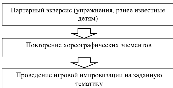
Рисунок 2 – План работы педагогов танцевального коллектива «Next time»

Практически по всех группах обучающихся педагоги «Next time» работали по плану (рис. 2):