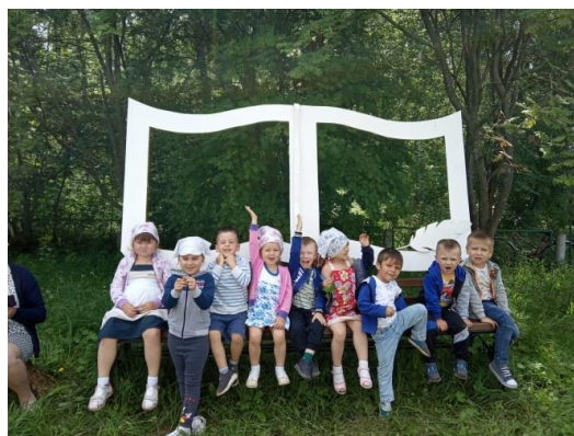
Рисунок 2 – Библиотечная фотозона

Специально для проекта «Книжная лавочка» была придумана и воплощена в металле скамейка арт-объект: длинная скамья со спинкой в виде раскрытой книги с закладкой, в страницах вырезаны большие окошки, имитирующие иллюстрации. И каждый может стать персонажем этой книги. А для самых маленьких сзади приварена ступенька, чтобы можно было встать повыше и гармонично сфотографироваться. Установленная в 2020 году, эта скамья стала символом, достопримечательностью библиотеки и прекрасной фотозоной (рис. 2).