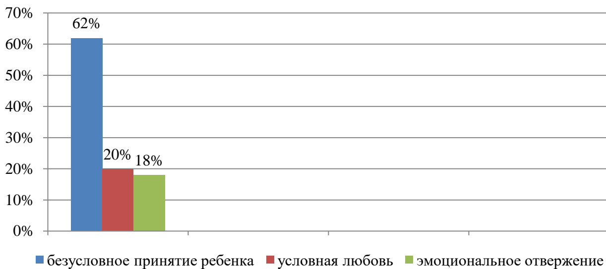
Диаграмма 1. Эмоциональное отвержение

Методика «Семья глазами ребенка» направлена на определение уровня эмоциональной атмосферы в семье. Результаты показали, что в большинстве семей (52%) имеет место положительная атмосфера, нейтральная – 13 %, отрицательная – 35% (см. диаграмму 2.).