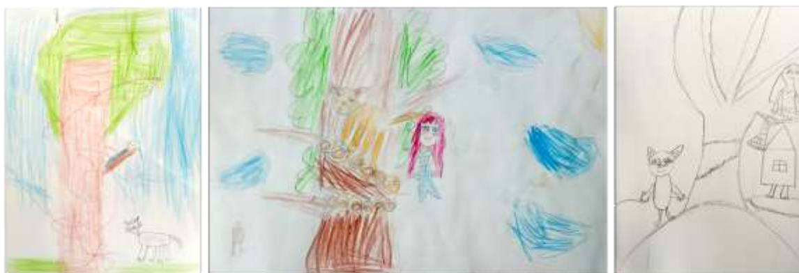
Рис. 1. Примеры детских работ в конце урока