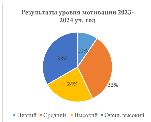
Рис.1. Результаты уровня учебной мотивации за 2023-2024 уч. год у 5-го класса