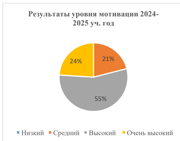
Рис.2. Результаты уровня учебной мотивации за 2024-2025 уч. год у 6-го класса

Анализируя таблицу 1, рис.1, рис.2 можно отметить, что уровень мотивации у учащихся в течение исследования повысился. На начало исследования у двух учащихся был низкий уровень, на конец исследования он повысился до среднего. У двух учащихся был средний уровень на начало исследования, на конец один учащийся повысился до высокого и очень высокого уровня. Остальные учащиеся держатся на уровне «высокий» и «очень высокий».